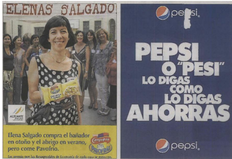
A la izquierda, la campaña de Campofrio ganadora. A la derecha, el cartel de la de Pepsi que protagonizó Fernando Torres.

Fueron los más eficaces en opinión del jurado de esta edición, pero no los únicos. Los oros –el máximo reconocimiento– fueron para el Ayuntamiento de Pamplona y GAP'S; Atrápalo y DobleYou; Campofrio y McCann Erickson; Damm y Villarosà; FSC Inserta / Fundación Once y Shackleton; Lactalis Iberia y Bassat Ogilvy; McDonald's y TBWA España, Mitsubishi y Remo; Pepsico y OMD, Promotor y DDB España; Roca Sanitario y Tiempo BBDO; y Zapata Inmobiliaria y BTOB. DDB fue elegida la agencia creativa más eficaz y Arena Media, la mejor agencia de medios.